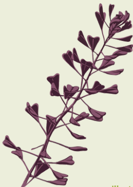
Illustrazione Alessia Nobile

E' in fase di sottoscrizione una convenzione con l'Associazione Aura Blu per la realizzazione di un progetto di Montagnaterapia. Si effettueranno uscite in località Timmari, Picciano, Diga di San Giuliano, Jazzo Gattini in date da definirsi