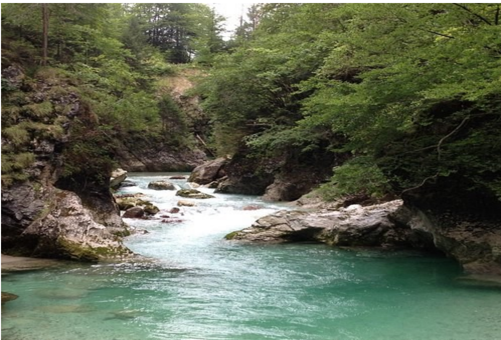
Orrido dello SLIZZA