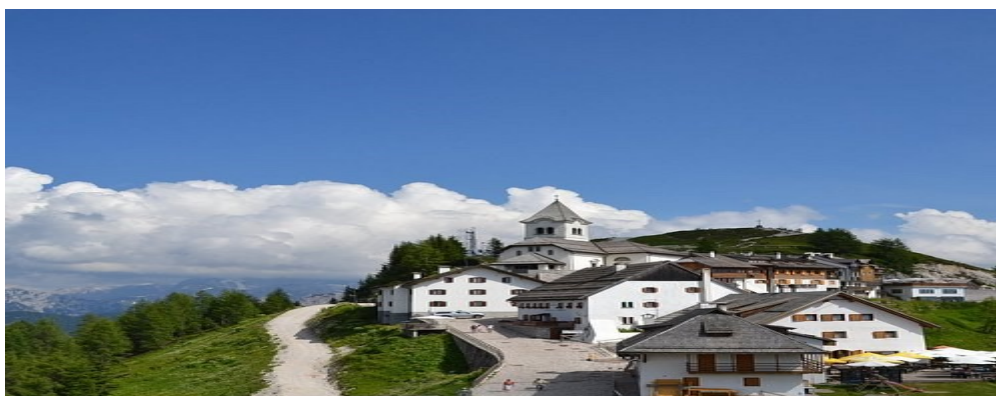
Sacro Monte LUSSARI