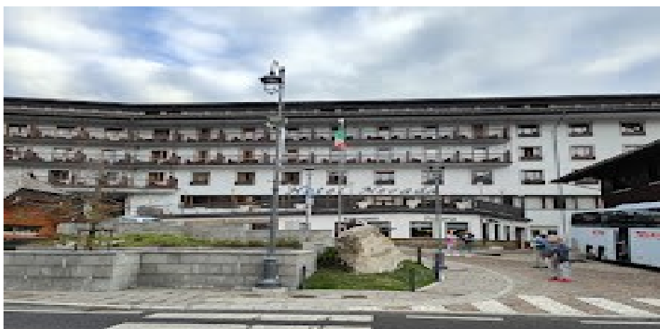
Panoramica Hotel NEVADA