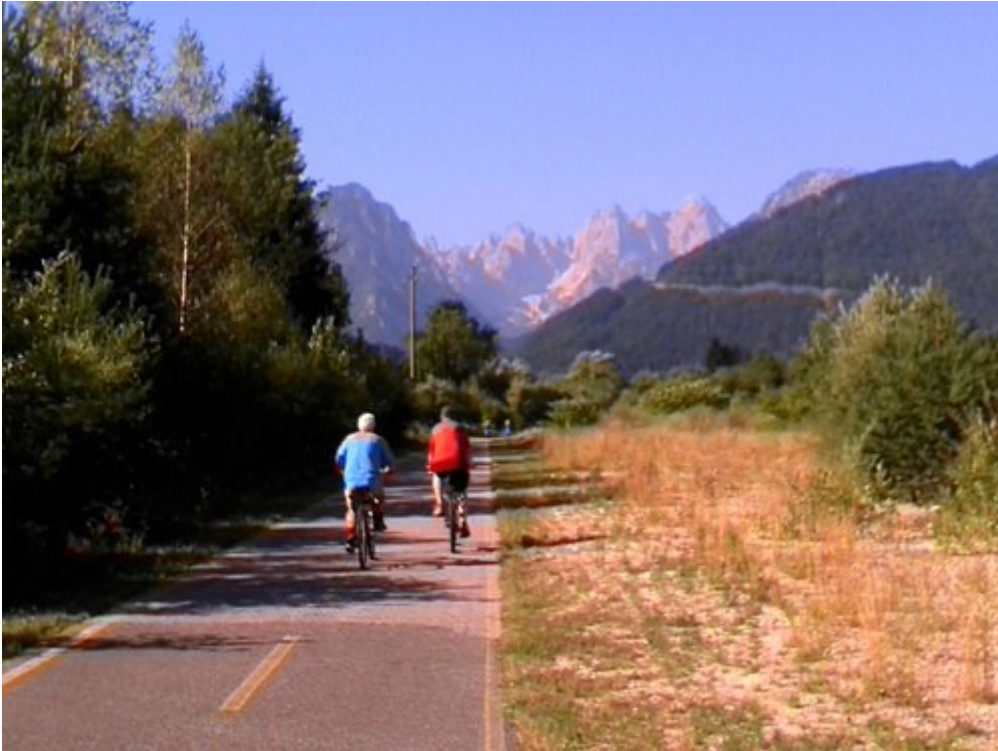
Pista ciclabile ALPE ADRIA