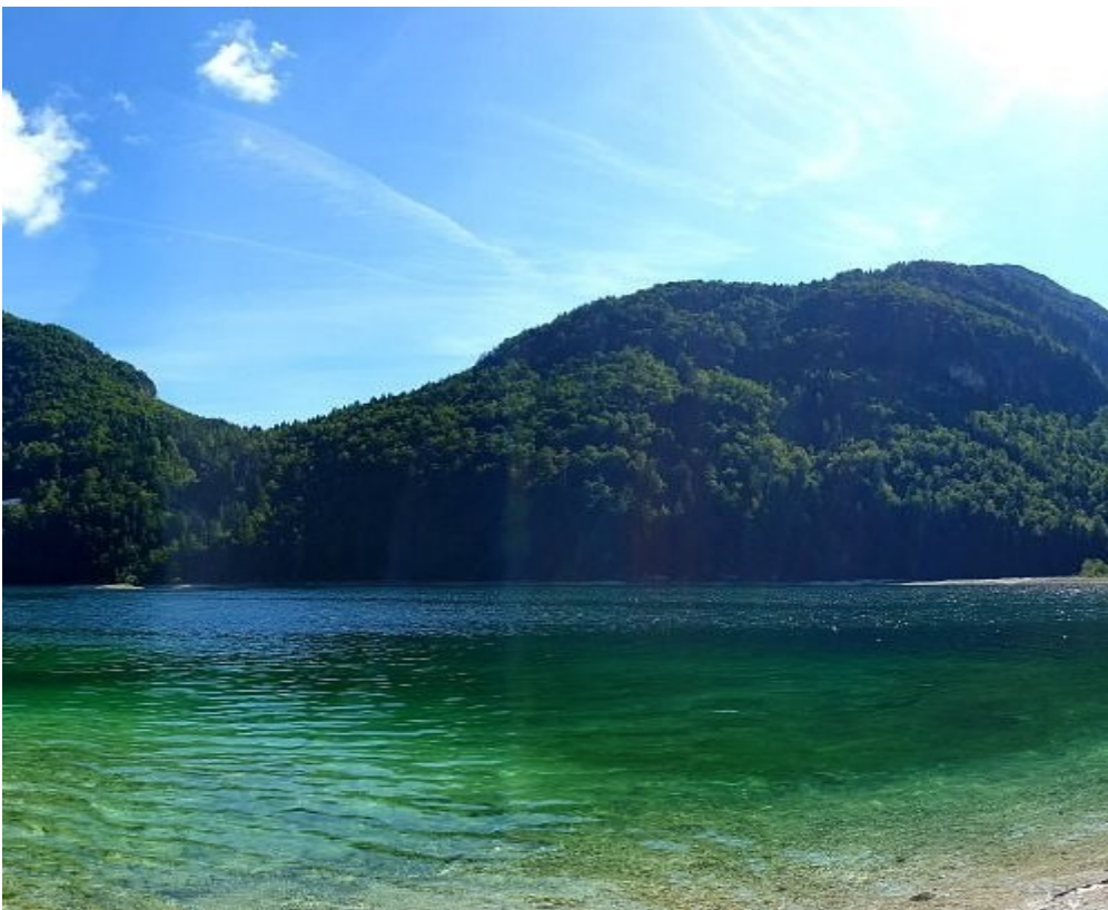
Lago del PREDIL