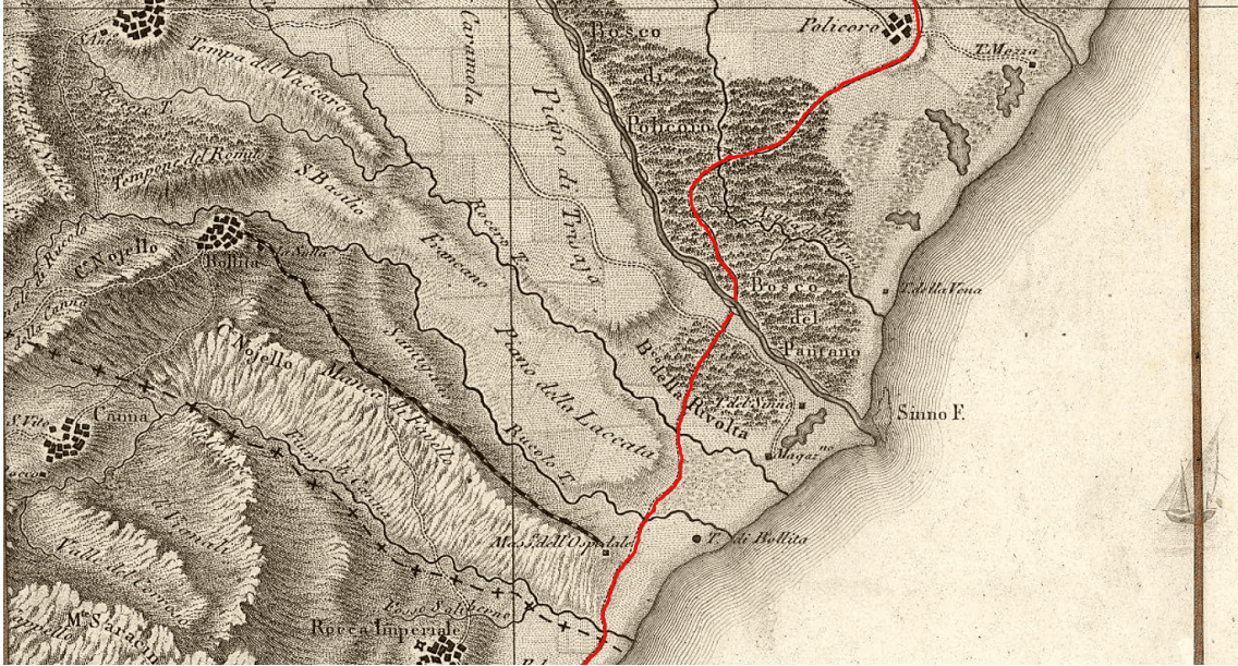
Tratturo del Re nel tratto compreso tra i comuni di Bollita (Nova Siri), Rotunda Maris (Rotondella) Pollicoro (stralcio da mappa Rizzi Zannoni, 1807)